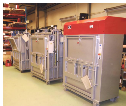
NVA har producerat mer än 15 000 balpressar sedan mitten av 60-talet.