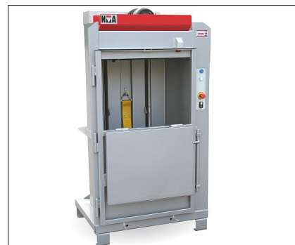
Luckan stannar som standard rakt ut men kan även fällas helt ned, anpassad efter behov.