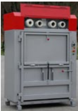
Enkelt byte av balningsband

NP 80 med den unika tysta och självmörjande skruvdriften innehåller ingen hydraulik. Detta uppskattas av företaget som prioriterar hållbara lösningar för miljön såväl som ekonomin.