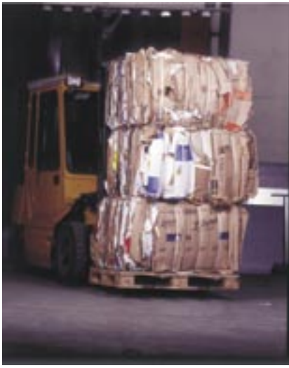
Stabila, stapelbara balar för god lagrings- och transportekonomi.