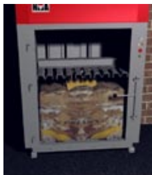
Pressplattan trycker ihop materialet till en bal.