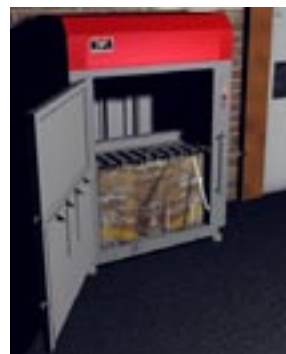
Vid indikering av färdig bal, öppna dörren och banda balen.