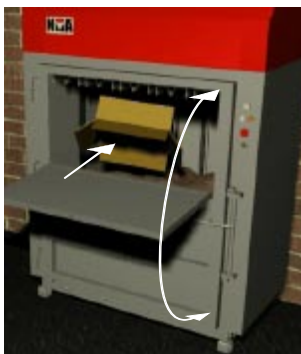
Låg inkasthöjd och en rejäl ifyllnadsvolym. Stäng luckan för automatisk pressning.

Tack vare sin låga höjd kan NP 80 placeras nära källan för det pressbara materialet och är enkel att flytta vid ändrade behov.