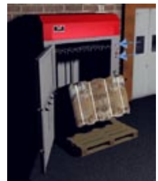
Smidig och säker uttipping.